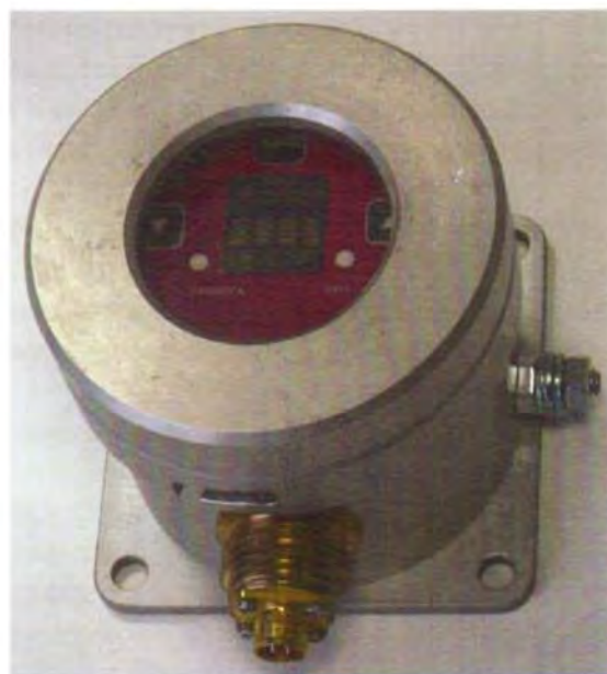
Рисунок 3 – Внешний вид газоанализаторов стационарных оптических ГСО-Р1, индикатор ГСО-Р1И (алюминиевый корпус)