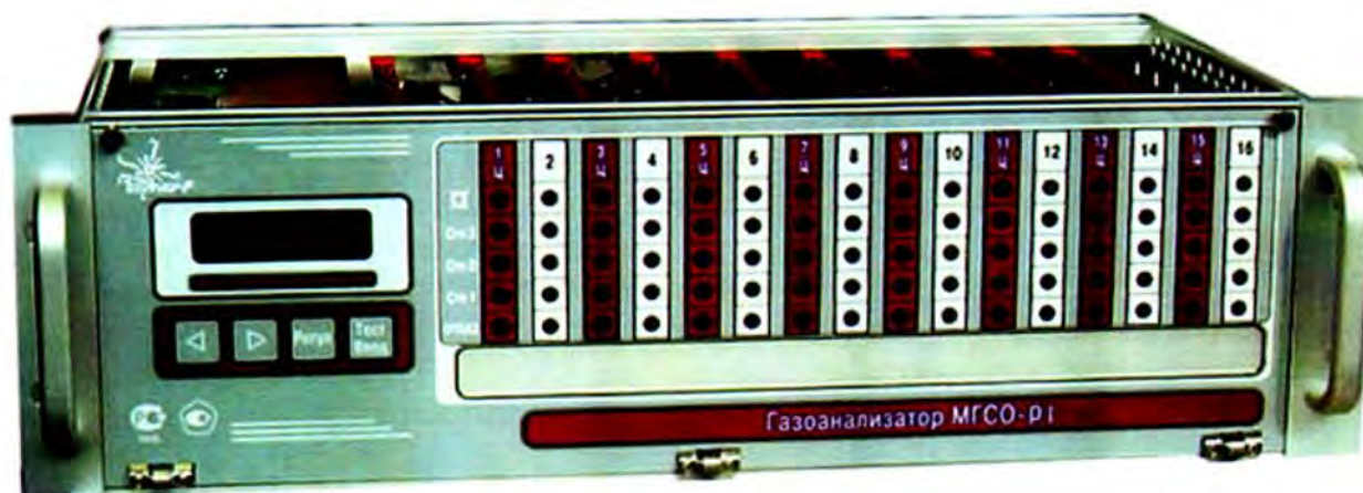
Рисунок 4 – Внешний вид «Терминал-А» газоанализаторов стационарных оптических МГСО-Р1