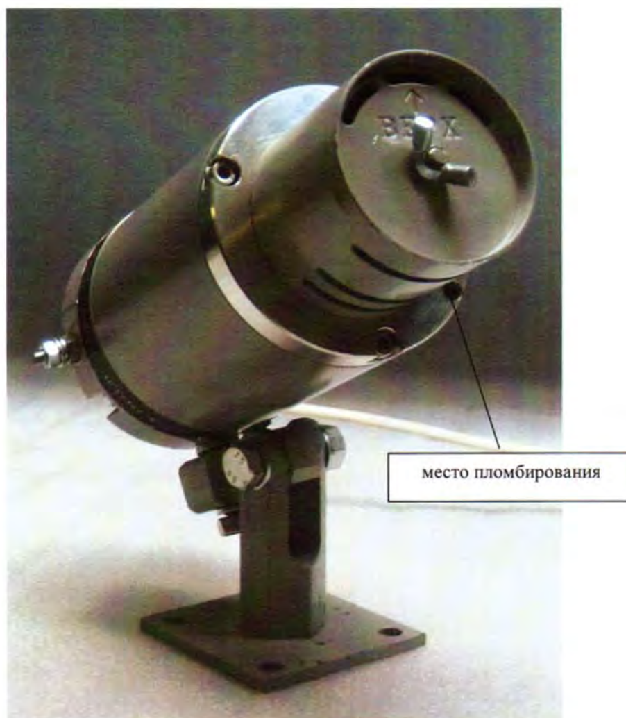
Рисунок 1 – Внешний вид газоанализаторов стационарных оптических ГСО-Р1, датчик ГСО-Р1Д (алюминиевый окрашенный корпус)

Внешний вид газоанализаторов приведен на рисунках 1 - 4.